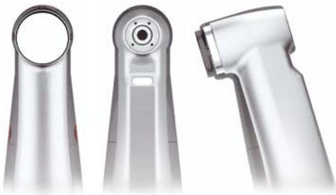
NOVA / CA CLASSIC