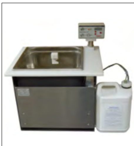
2017-XE avec dispositif de remplissage du niveau d'eau dans la cuve et dispositif de pompage automatique du produit PROCLEAN