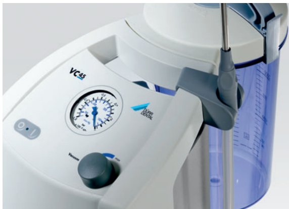
Dépression maximale allant jusqu'à 910 mbar