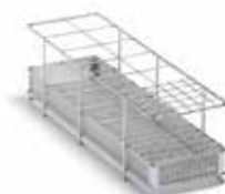
Élément pour instruments en position verticale