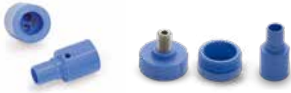
Adaptateur pour turbines