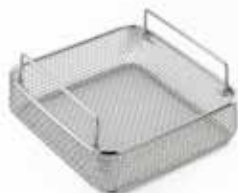
Panier à filet DIN 1/2