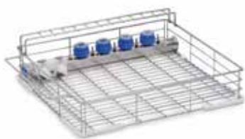
Panier de chargement avec 4 supports pour pièces à main, 5 injecteurs pour corps creux, 2 connexions pour tuyaux d'aspiration