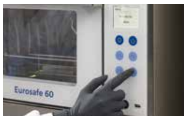
Gestion à plusieurs utilisateurs

Le processus de désinfection peut être géré par plusieurs opérateurs (jusqu'à 30), après authentification par saisie du mot de passe. De cette manière, chaque activité est validée, documentée et associée à l'opérateur de référence.