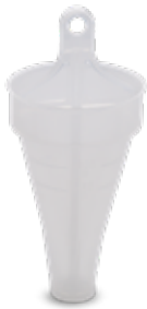
Entonnoir pour le chargement du sel