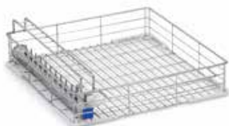
Panier de chargement avec 11 injecteurs pour corps creux et 2 connexions pour tuyaux d'aspiration