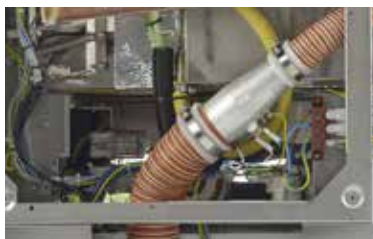
Séchage à l'air forcé