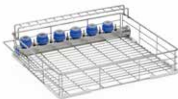
Panier de charge avec 6 portoirs à pipettes et 6 injecteurs pour les objets creux