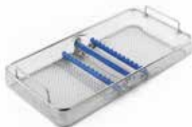
Panier à filet DIN 1/1 pour les instruments rigides