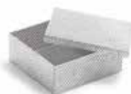
Corbeille pour fraises et petits ustensiles