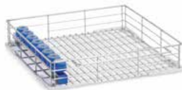
Panier de chargement avec 8 supports pour pièces à main