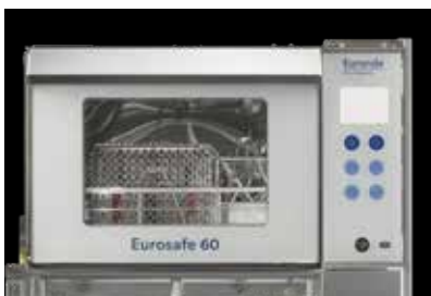
Porte transparente en double vert trempé

La porte transparente en double vert trempé permet de surveiller facilement le contenu lors du cycle. De cette manière, il est possible de s'apercevoir rapidement des éventuels blocages dus à un mauvais positionnement des instruments, et de s'assurer du bon déroulement de l'activité en cours.