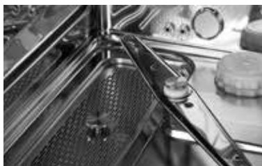
Système de lavage par injection

Eurosafe 60 a été conçu dans le respect total de l'environnement. Les consommations en électricité et en eau sont optimisées : 1,7 KW et 12 litres d'eau pour chaque cycle short.