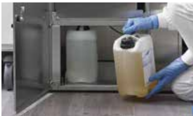
Doseur automatique de détergent

Le thermo-désinfecteur Eurosafe 60 effectue en un seul cycle le prélavage, le lavage, le rinçage, la désinfection et le séchage, éliminant tout nettoyage manuel. Dans des temps moindres et avec des efforts réduits, Eurosafe 60 assure des résultats efficaces et efficients, protégeant l'opérateur contre les risques dus à la manipulation d'instruments contaminés, dans le respect de l'environnement, notamment grâce à la possibilité de régler l'utilisation des détergents avec le doseur automatique.