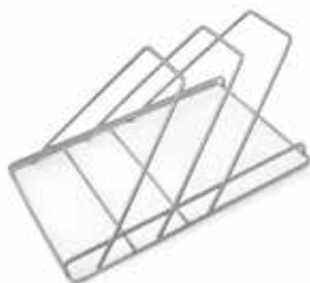
Élément à 2 positions pour plateaux, cassettes d'instruments (pas de 50 mm)