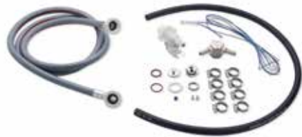
Kit pour raccord eau déminéralisée