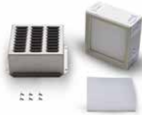
Filtre air HEPA