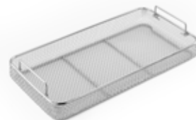
Panier à filet DIN 1/1